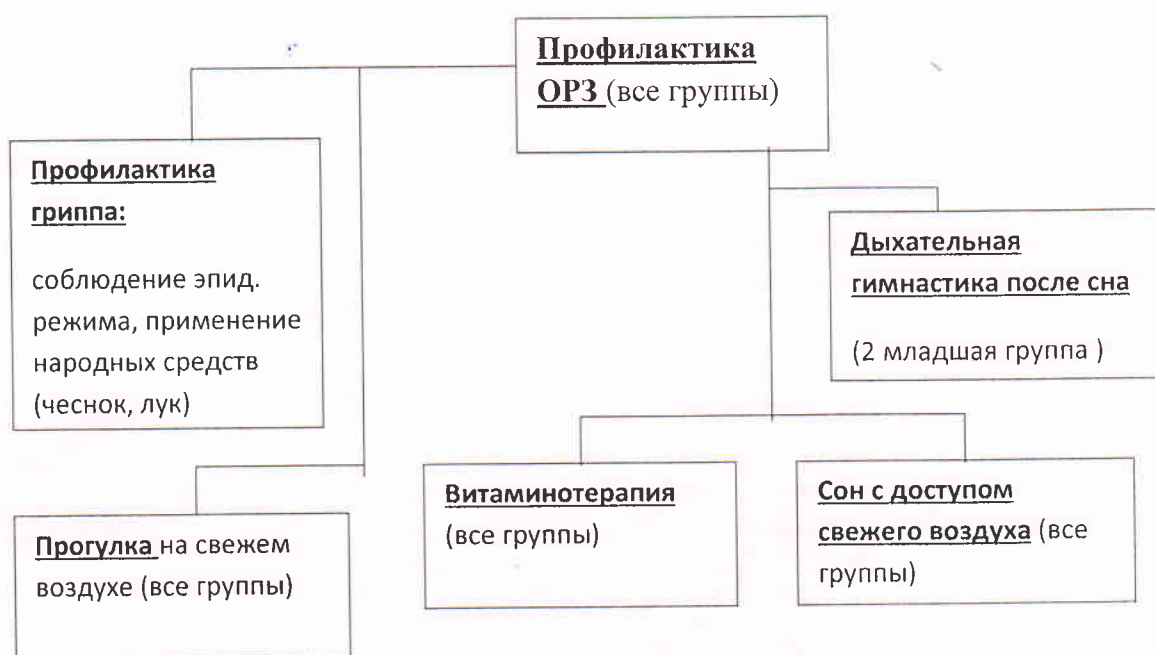
Схема оздоровительных мероприятий в детском саду № 102