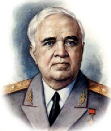
Композитор Александр Васильевич Александров

Утверждён 25 декабря 2000 (музыка) 30 декабря 2000 (слова)