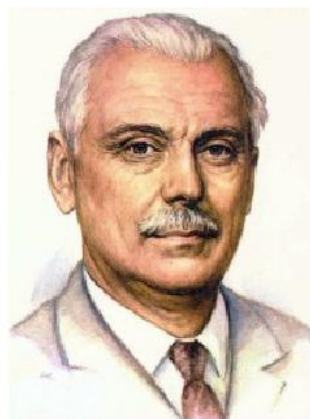
Автор слов Сергей Владимирович Михалков